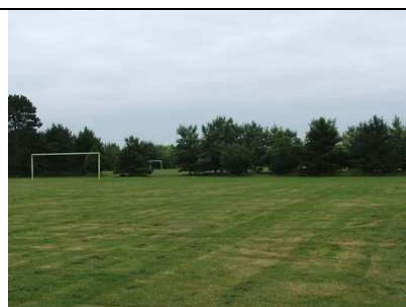
Le terrain de foot