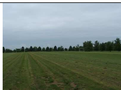
Le terrain de rugby