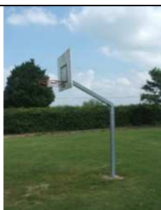
Le panneau de basket