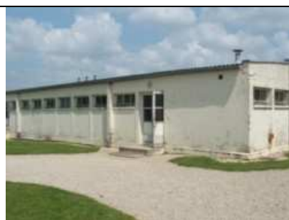
La salle de travail