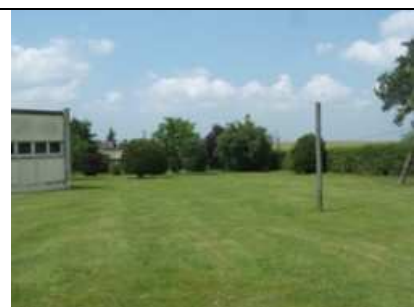
Derrière la salle de travail